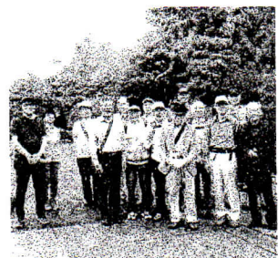
目に入らないように工夫されていた。

最後に見学したのが旧岩崎邸と庭園です。三菱財閥、岩崎家の本宅建物と庭園を見学してきました。平塚に帰ってきたのは17時を過ぎていました。村松 一男 記