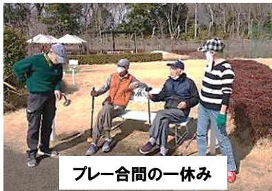
プレー合間の一休み

ホールインワンを運よく達成！幸先の良い出陣でした。(当日スコア64/66) 5月以降もアンダーパー